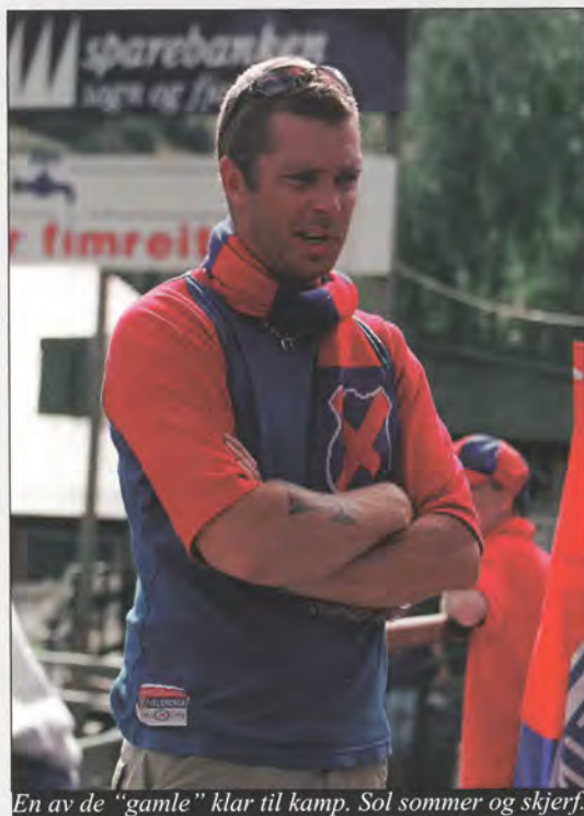
En av de "gamle" klar til kamp. Sol sommer og skjerf.

Velkommen til en livslang reise med Vålerenga Idrettsforening og Klanen!