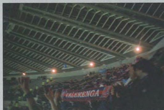
Bilde 1,2,3 På vei til St. James` Park Bilde 4 Opp med skjerfet.