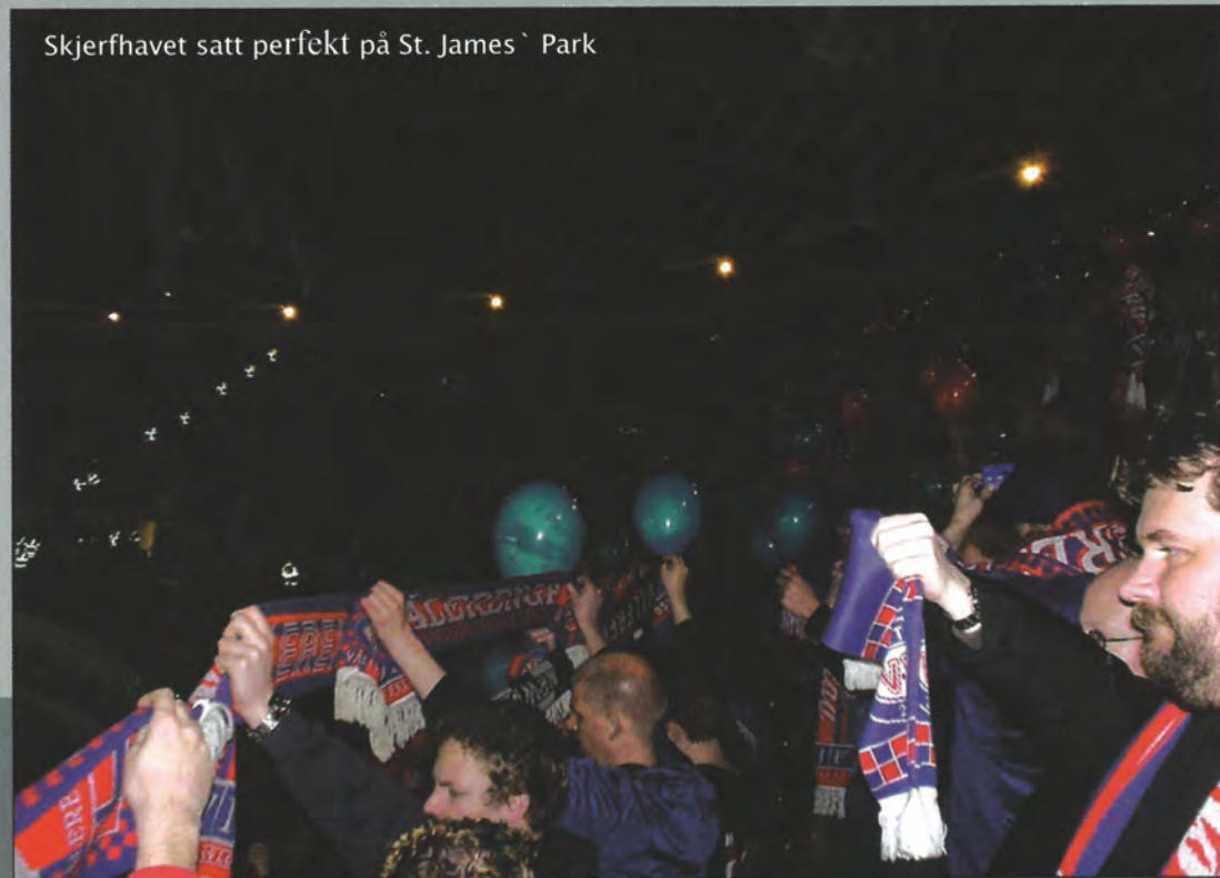
Skjerfthavet satt perfekt på St. James` Park

Vi og resten av flygjestene som skulle til Newcastle tok ikke den siste beskjeden så veldig positiv imot og alle stormet ut mot innsjekkingsranken hvor en liten stakkar satt og prøvde å roe ned gemyttene. Lite hjalp det at nissen i skranken fortalte alle at de kunne reise med neste fly som gikk dagen etter, når vi allerede visste at flyene de neste 3 dagene var full-bookede. Åh ja, nevnte jeg at vi fikk det sjenerøse tilbudet om å få pengene for flyturen tilbake? Hele £ 20,- skulle vi