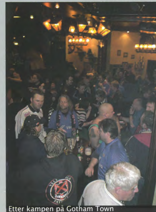
Etter kampen på Gotham Town