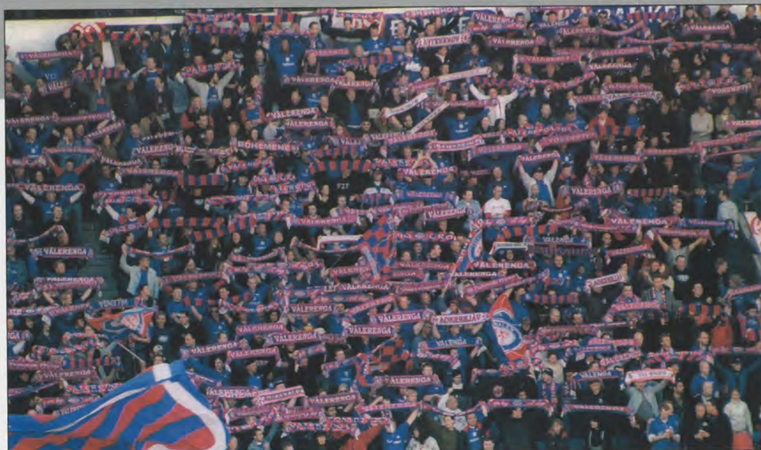
Skjerfet er ikke bare til å varme halsen - denne tøffilla skal brukes året rundt.

starter når spillerne entrer matta sammen med motstanderlag og dommertrio. Små flagg skal viftes med, ark skal holdes over hodet, stripes og overheadbannere skal dekke deler av tribunen. Alt tas vekk når kampen sparkes i gang – så du går ikke glipp av noe om hodet er dekket i 3-5 minutter.