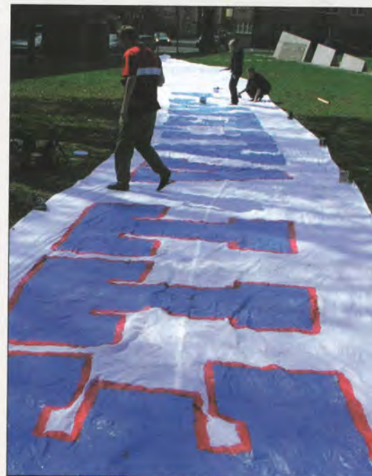
Dugnad i Sofienbergparken

Ellers er det mange måter å engasjere seg på. Tifograppa nedlegger et enormt arbeid for Klanen, de klipper og tegner, syr og maler. Tifo betyr fra italiensk "å heie", og det er en flott måte å markere seg på