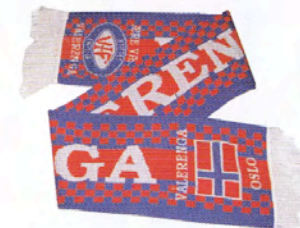
Artikkel nr. 103 Årets Vålerenga skjerf kr. 130.-