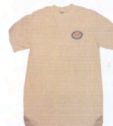
Artikkel nr. 104 Enkel og greit! Hvit T-skjorte med klubb logoen kr. 99.-

For andre nyheter og vårt faste vareutvalg: