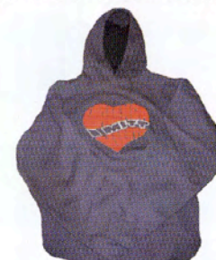
Artikkel nr. 102 Hettegenser med "Vål'enga i mitt hjerte" logo, 2 stikkklommer kr. 499.-

Og for de litt større medlemmene har vi bl.a. dette: