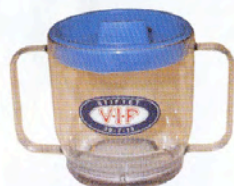
Artikkel nr. 99 VIF drikkemugge kr. 79.-

Til bitte små klansmedlemmer har vi følgende nyheter: