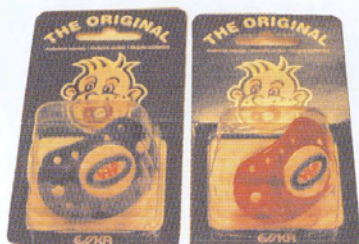
Artikkel nr. 100 Smokk i rød eller blå kr. 49.-