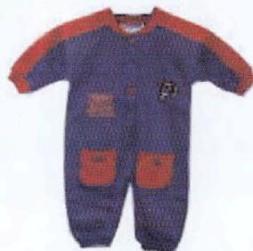
Artikkel nr. 101 Joggedress for barn Kr. 249.-

For andre nyheter og vårt faste vareutvalg: