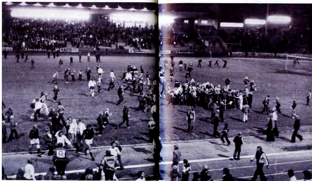
Etter VIF - Lyn, seint på 70-tallet

å velge et annet lag som bedre symboliserer hvem de er og hva de står for. Hvis noen av dere tror vi har et dårlig forhold i familien så er også det feil. På tross av klubbtilhørighetene vi har valgt, eller som har valgt oss så er vi store nok