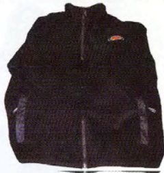
Artikkel nr 105 Fleecejakke med VIF logo Kr. 299.-